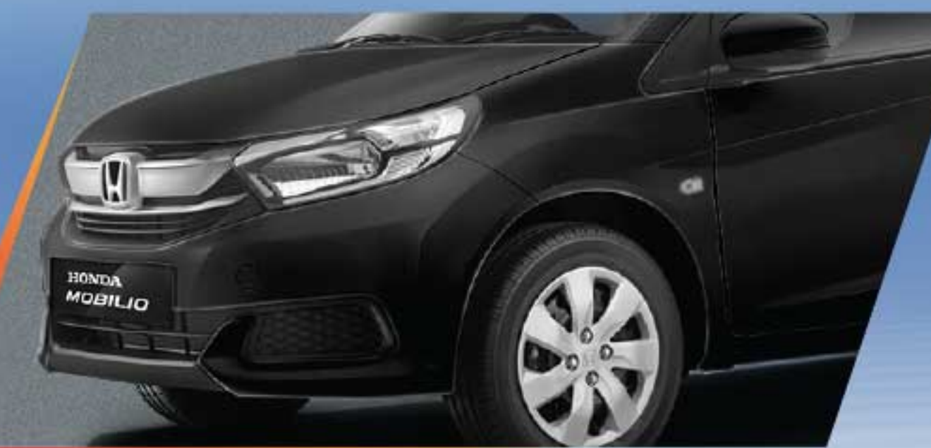
Crystal Black Pearl