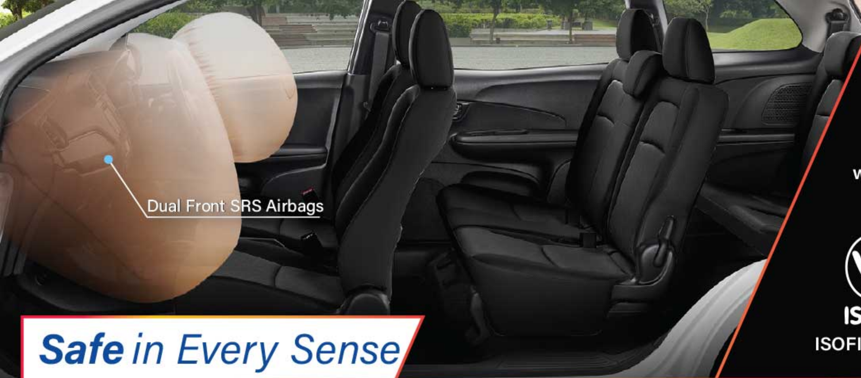
Dual Front SRS Airbags