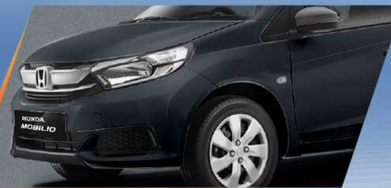
Meteoroid Gray Metallic